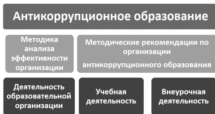
Рис. 2. Система работы по антикоррупционному образованию

Система работы по антикоррупционному образованию и оценка его представлена на рис. 2.