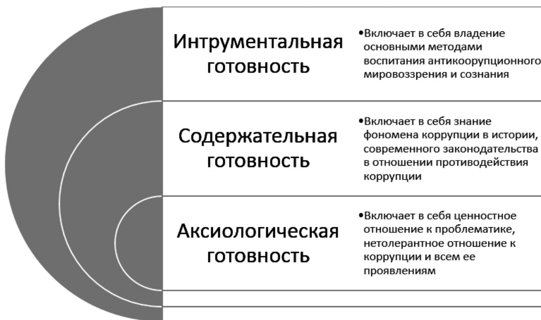
Рис. 1. Структура понятия «готовность педагога к антикоррупционному воспитанию»

Таким образом, вопрос о подготовке педагога к осуществлению профессиональной деятельности – предмет разнообразных педагогических и психологических исследований на теоретическом и методологическом уровнях. Опираясь на имеющиеся теоретические конструкции, предлагаем педагогическую модель включения в программы подготовки учителя сюжетов, связанных с готовностью педагогов к воспитательной деятельности в сфере формирования антикоррупционного сознания, навыков антикоррупционного поведения – антикоррупционного воспитания.